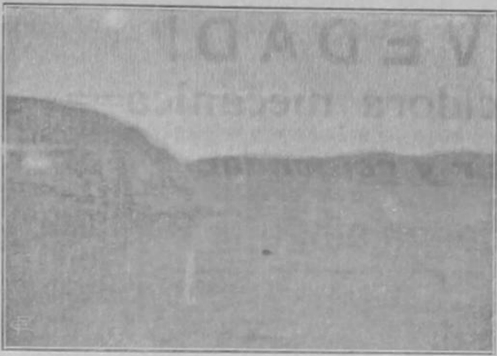
Aspecto general de la entrada á la Isla penitenciaria, que los veraneantes de Puntarenas visitan siempre que es posible.